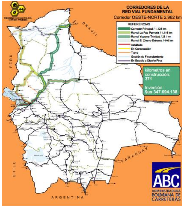
Figura 1: Red vial fundamental